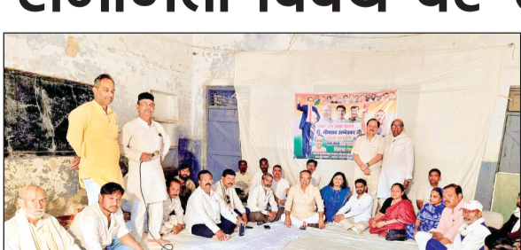
विदिशा। राजीव गांधी स्मृति शिक्षण संस्थान में आयोजित किया गया कार्यक्रम।