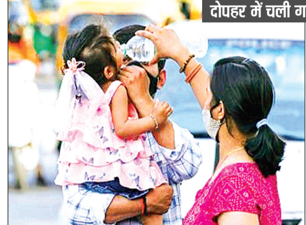
दोपहर में चली गर्म हवा, बाजारों में सन्नाटा

शनिवार और रविवार 40 डिग्री के पार होगा तापमान मौसम विभाग के अनुसार, उत्तर-पश्चिमी हवाओं के प्रभाव से तापमान में लगातार वृद्धि हो रही है। आने वाले दिनों में दिन का तापमान 40 डिग्री सेल्सियस या उससे अधिक दर्ज किया जा सकता है। रात के तापमान में भी धीरे-धीरे बढ़ोतरी हो रही है, जिससे गर्मी का असर देर रात तक महसूस किया जा रहा है। विशेषज्ञों का कहना है कि यदि यही स्थिति बनी रहती तो अगले सप्ताह से लू चलने की संभावना भी बढ़ जाएगी।