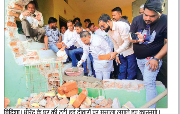
विदिशा। धीरे-धीरे के घर की टूटी हुई दीवारों पर मसाला लगाते हुए कानूनगो।

अस्पताल में वाई बाय का काम करने वालों ने भी सौंपा ज्ञापन। हरिभूमि न्यूज | विदिशा