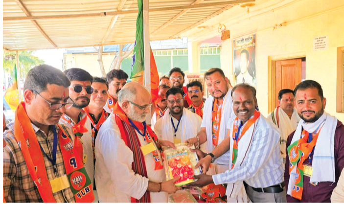
सामूहिक गायन किया गया। इसके पूर्व संगठन द्वारा लगाए गए पंजीयन काउंटर पर

भारतीय जनता पार्टी प्रदेश संगठन के आख्यान पर मंडल एवं बूथ केंद्रों के कार्यकर्ताओं को संगठन की कार्यशैली एवं दक्षता प्रशिक्षित करने के उद्देश्य आयोगित हो रहे पंडित दीनदयाल उपाध्याय प्रशिक्षण महाअभियान की श्रृंखला में नगर मंडल सिरोंज के वर्ग का शुभारंभ हुआ। मंगलवार शाम उमाश्री गार्डन में प्रारंभ हुए प्रशिक्षण वर्ग का शुभारंभ अतिथियों द्वारा भागत माता, डॉ. श्यामाप्रसाद मुखर्जी के चित्रों पर माल्यार्पण एवं दीप प्रज्वलन एवं पार्टी के गीत गायन कर किया गया। तथा राष्ट्रीय गीत का