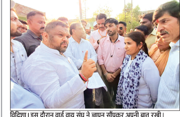
विदिशा। इस दौरान वाई वाय संघ ने ज्ञापन सौंपकर अपनी बात रखी।